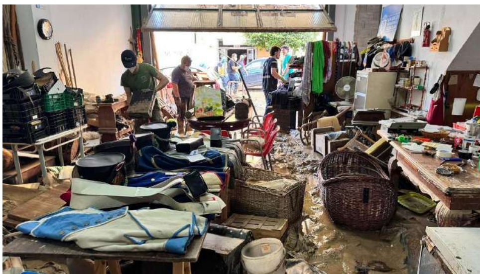
Trabajos de limpieza en la sede de la Asociación Napoleónica de Algemesí, afectada por la inundación.

La entidad pierde gran parte del material que utiliza en sus representaciones, desde el campamento a la indumentaria, tras la inundación de la sede que tiene en Algemesí