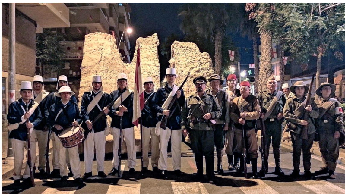
Escenificación de la Guerra del Rif (1911-1927) en el desfile de Moros y Cristianos de Mutxamel (Alicante)